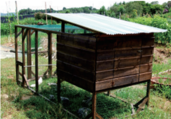
韩国有机农业产地洪东社区别具匠心的鸡舍。

在创造出二三十个社企业及社区组织的洪东社区,人们都特别强调Poolmoo学校至关重要作用。这个效仿丹麦民间中学模式的社区学校创办至今已逾50年,它通过办学使农村(社区)发生改变为