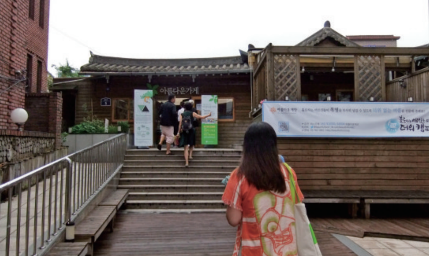
大名鼎鼎的美丽商店(120多家分店中的老资格)。