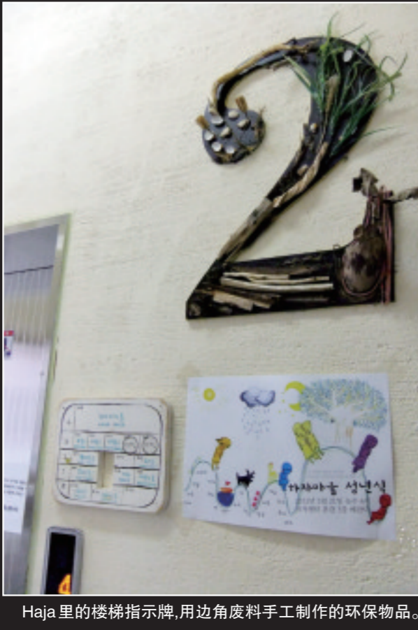
Haja里的楼梯指示牌,用边角废料手工制作的环保物品。